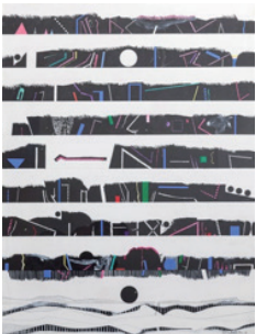
Genichiro Inokuma (猪熊弦一郎) Land Scape, 1973 Acrylic on board 103.0cm x 77.0cm