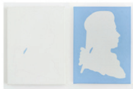
Daan van Golden Golden/Mozart, 2010-2011 Oil and Pencil on canvas (Left)40x30cm, (Right)40x 30cm