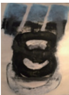
Kumi Sugai (菅井汲) NAGARE (FLOW), 1961 Oil on canvas 130 cm x 97.6 cm