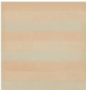
Agnes Martin Untitled, 1977 Watercolor and graphite on paper 22.9cm x 22.9cm