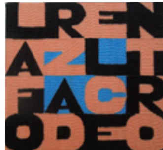
Alighiero Boetti La Forza del Centro, 1990 Embroidery 22.5 cm x 23.5cm